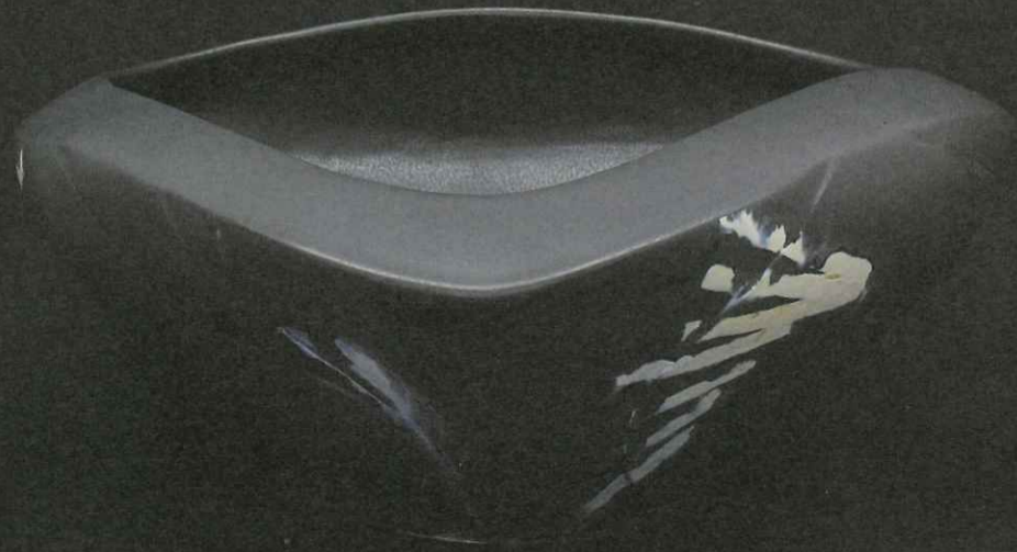
玄幽織部三方大鉢 (W42.0×D41.5×H18.8cm)