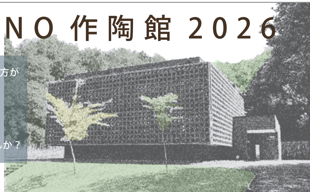
木々に囲まれ小鳥のさえずりがきこえます。本館には現代陶芸美術館があり作品鑑賞も楽しめます。