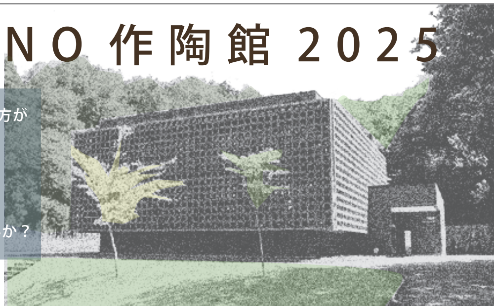
木々に囲まれ小鳥のさえずりがきこえます。本館には現代陶芸美術館があり作品鑑賞も楽しめます。