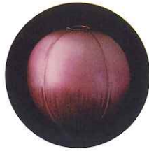
阪口 浩史 「紅紫の器『実り』」