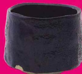
加藤孝造「瀬戸黒茶盃」