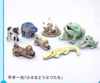
平手一光「小さなどうぶつたち」