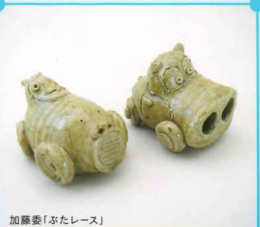
加藤委「ぶたレース」