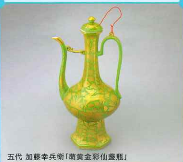
五代 加藤幸兵衛「萌黄金彩仙壺瓶」