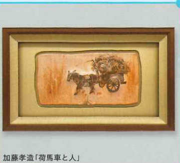
加藤孝造「荷馬車と人」