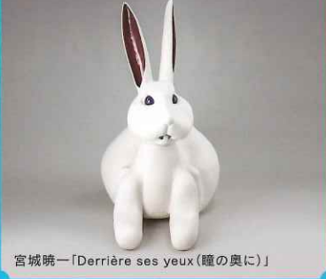
宮城暁一「Derrière ses yeux (瞳の奥に)」