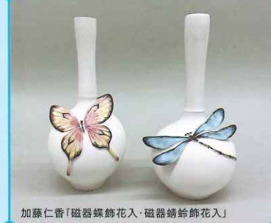
加藤仁香「磁器蝶飾花入・磁器蜻蛉飾花入」