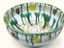
加藤卓男「ベルシャ三彩胡姬文茶碗」