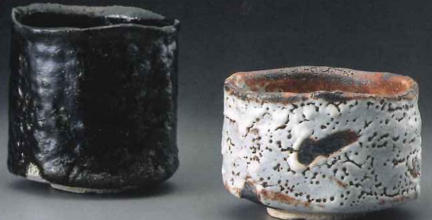
加藤亮太郎「瀬戸黒茶碗・志野茶碗」