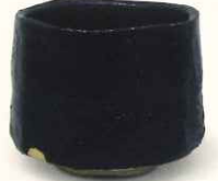
加藤孝造「瀬戸黒茶碗」