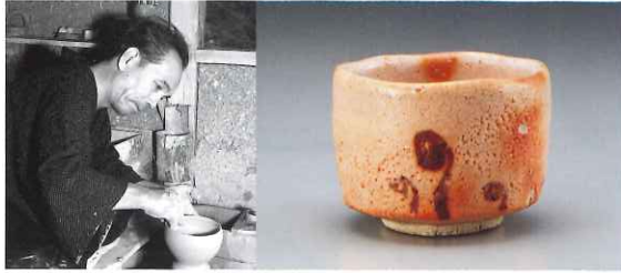
「志野蒔絵茶碗 早春」(荒川豊蔵資料館蔵)