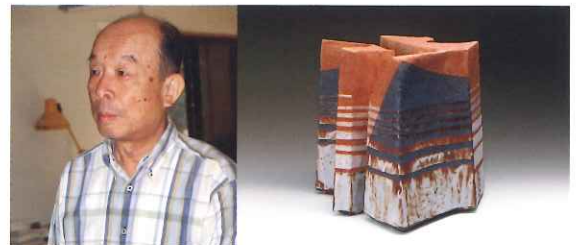
「志野花器」(岐阜県美術館蔵)