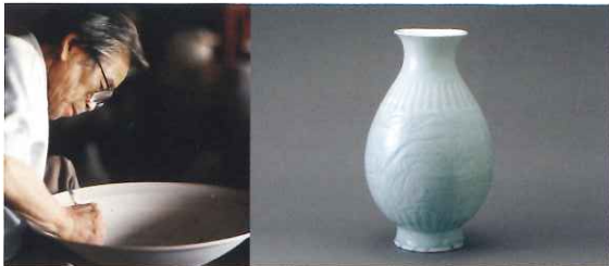
「青白磁花鳥文壺」(土岐市美濃陶磁歴史館蔵)