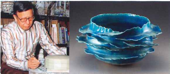
「青釉銀華花形花器」(市之倉さかづき美術館蔵)