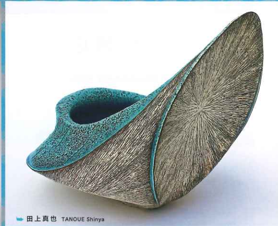
田上真也 TANOU Shinya