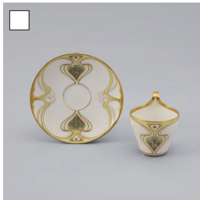
KPMベルリン 《植物文カップ&ソーサー》 20世紀初頭