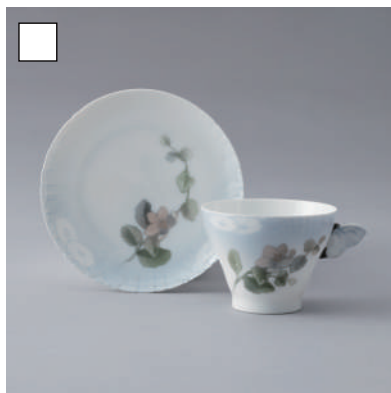
ロイヤル・コペンハーゲン 《花文カップ&ソーサー》 1902-1922年