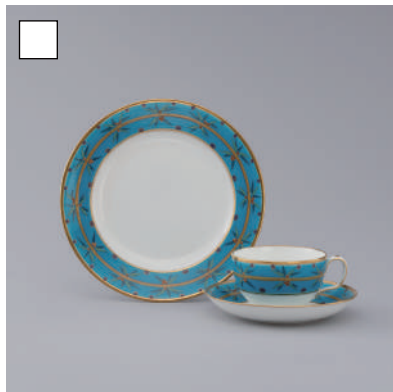
ミントン 《植物文トリオ》 1871年