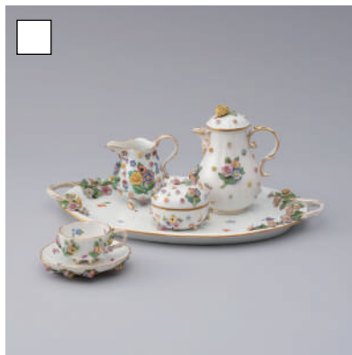
マイセン《花飾ティーセット》 19世紀後半