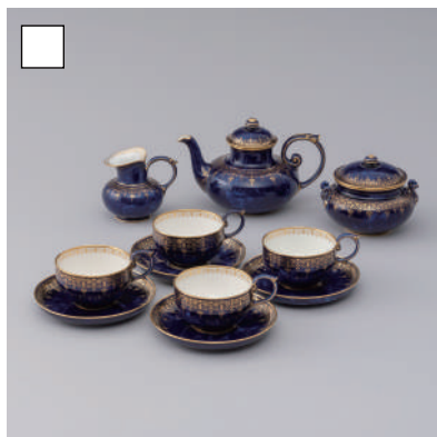
セーヴル 《ティーセット「クラウデッド・ブルー」》 1876年