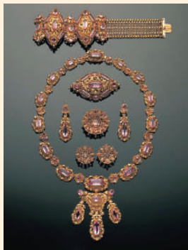
《ピンクパールズ&カラーゴールド・スウィート》1830年頃 機業アンティークジュウリー美術館蔵

19世紀のイギリスでは、ヴィクトリア女王の時代(1819～1901年)に、ジュエリーが大きな発展を遂げました。本展覧会では、ヴィクトリア時代のジュエリーを中心に、英国王室にまつわる作品など、イギリスの華麗なアンティーク・ジュエリーの数々を、国内の個人コレクションに基づいて紹介します。併せて、セレモニーなどで用いられた衣装、洋食器、レース等も出品します。この多彩な展示を通じて、イギリス文化の精華をお楽しみください。