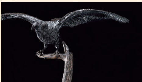
本郷真也《Visible 01》—ハンボンソガラス— 2021年 鉄、銀 個人蔵

「超絶技巧!明治工芸の粹」展、「驚異の超絶技巧!明治工芸から現代アートへ」展で多くの観衆を魅了した「超絶技巧」シリーズの第3弾。金属、木、陶磁、漆、ガラスなど様々な素材により、新たな表現領域を探索する現代作家の作品をご紹介します。また、これらの作家を刺激してやまない明治工芸の逸品も併せて展覧。進化し続ける超絶技巧の世界をご堪能ください。