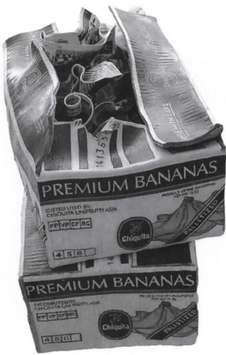
みしまきみよ 三島喜美代 《バナナボックス》 2007年