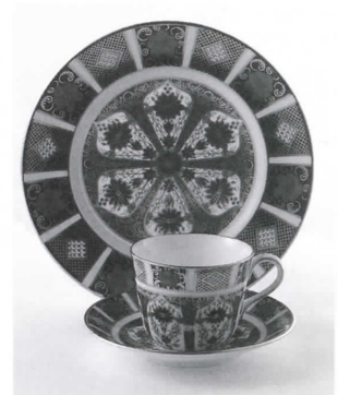
ロイヤルクラウンダービー 《ジャパン カップ&ソーサー》 2007年