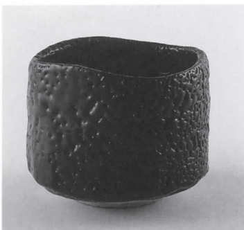
かとうこうぞう 加藤孝造 せとぐろちやわん 《瀬戸黒茶碗》 2002年