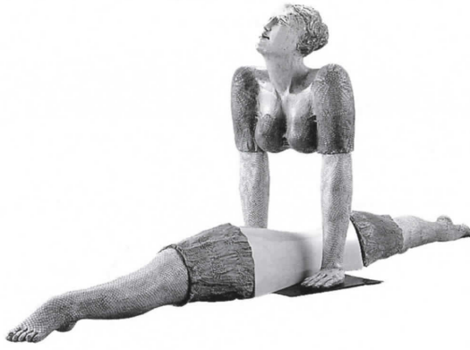
ヴィルマ・ヴィリャベルデ たいそうせんしゅ 《体操選手》 2000年