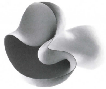
エヴァ・ヒルド むだい 《無題》 2000年