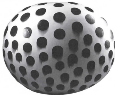
かねこじゅん 金子潤 《UNTITLED,1995》 1995年