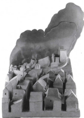
かわさきつよし 川崎毅 まち 《街》 1989年