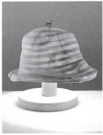
おじおかおる 小塩薫 こんせき けっしょう 《痕跡からの結晶 -today's diary-》 1999年