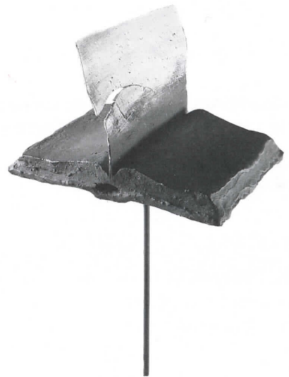
やぎかずお 八木一夫 ページ 《頁1》 1971年